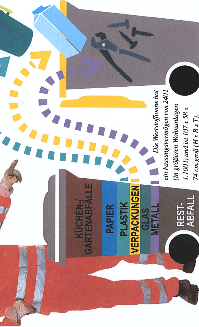
Die Wertstofftonne hat ein Fassungsvermögen von 240 l (in größeren Wohnanlagen 1.100 l) und ist 107 x 58 x 74 cm groß (H x B x T).

Metall und/oder Plastik. Das sind zum Beispiel Eimer, Gießkannen, Töpfe, Pfannen, Siebe, Trichter, Schlüssel, Schalen, Werkzeuge sowie Kinderspielzeug, Bügel, Türen und Folien. Wer bislang solche Abfälle im Restabfall entsorgt hat, sollte sie dann über die Wertstofftonne der Verwertung zuführen. Und nicht zuletzt gehören damit auch die Ärgernisse mit den Gelben Säcken der Vergangenheit an: Kein Reifsen und keine Verwehungen mehr. Außerdem entfällt das ständige Beschaffen.